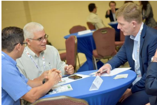
Encuentros bilaterales para analizar oportunidades de negocio entre EU y México