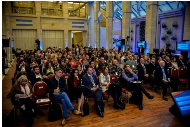
Organización de eventos en México