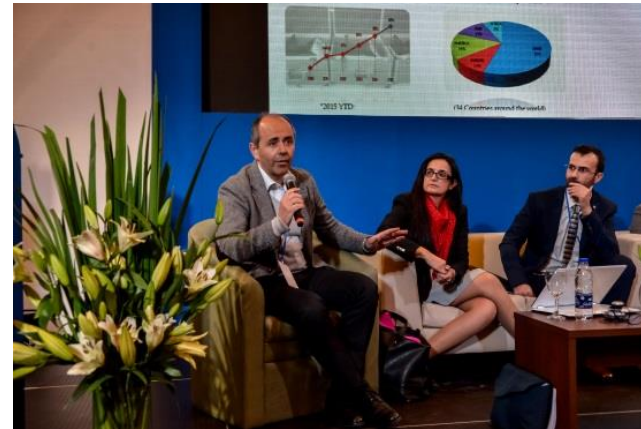
Presentación de organizaciones europeas durante los eventos