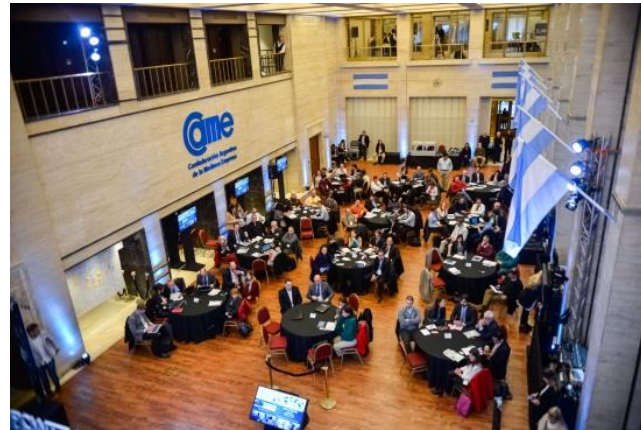
Sesiones de Co-creación para identificar oportunidades de negocio